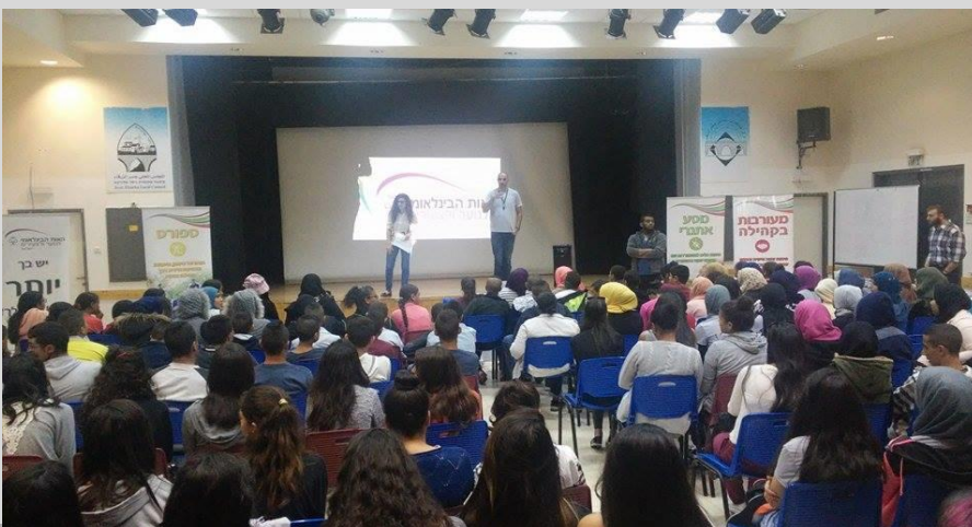
ימין למעלה: מחוז צפון; ימין למטה: מחוז מרכז; שמאל: מחוז חברה ערבית

שנת הפעילות נפתחה ברוב הוד והדר ברחבי הארץ, בסניפים הוותיקים וגם בסניפים החדשים – ההתרגשות גואה! בין גיוס ורישום לפעולות ראשונות, מצאנו גם זמן לקיים ימי פעילות מחוזיים, בהם התכנסו חניכי המחוזות השונים לערב שכולו היכרות, גיבוש וכיף. סניפי הצפון התארחו בדליית אל כרמל, שם הכירו זה את זה, עברו יחד סדנת צחוק, ועוד ועוד ועוד... סניפי החברה הערבית התארחו בכפר ג'סר א זרקא, שם פועל השנה סניף חדש של 'אות הנוער', לערב שכלל תחרות ומשימות, הרבה אוכל טוב, וגם שירה וריקוד. סניפי המרכז והדרום התארחו בסניף הדסים, ולאחר שהתפנקו בפופקורן, צמר גפן מתוק ופיצות לרוב, התפנו גם לשחק בתחנות משחק שהכינו עבורם המד"צים הטריים! יישר כח לכל הלוקחים חלק במלאכה, ובראשן רכזות המחוז הבלתי-נלאות שלנו! מאחלים לכולנו המשך שנת פעילות פורייה ומלאה בעשייה!