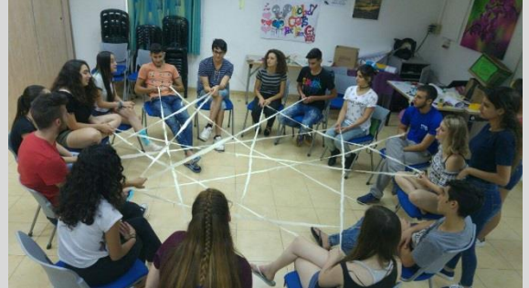
לומדים להכיר זה את זה