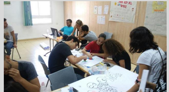
מתרגלים הכנת פעילות לחניכים