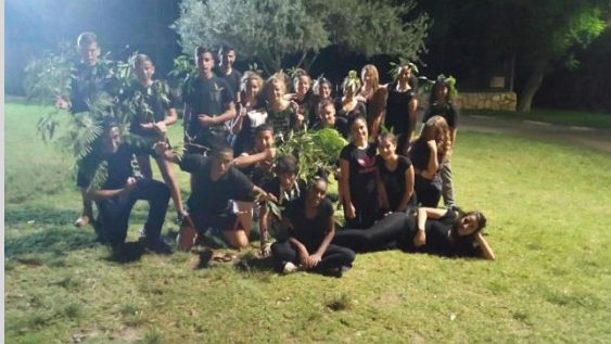
פעילות שטח – א"ש לילה לימודי

במהלך חופשת הקיץ האחרונה התכנסו חניכים וחניכות משלבי הכסף והזהב במעין חרוד, ופתחו בגאווה ובחיוך את המחזור הראשון של סמינר ההדרכה של 'אות הבינלאומי לנוער'. החניכים הגיעו מכל רחבי הארץ – יהודים וערבים, ותיקים ועולים, מהמרכז ומהפריפריה, ועוד. הסמינר מהווה חלק מתכנית מח"צ שלנו – תכנית להכשרת מנהיגות חברתית צעירה, בשיתוף קרן קרסו. במהלך הסמינר עסקו החניכים בנושאים הנוגעים לתפקידם העתידי כמד"צים (מדריכים צעירים): גיוס חניכים, גיבוש והבניית קבוצה, בניית מערכי פעילות, שיווק ופרסום, פעילות חוץ ושטח, ועוד. לאחר שבוע שלם של לימוד והכשרה, הוענקו לחניכים תעודות הסיום, והם חזרו לסניפים כחלק בלתי-נפרד מצוות ההדרכה.