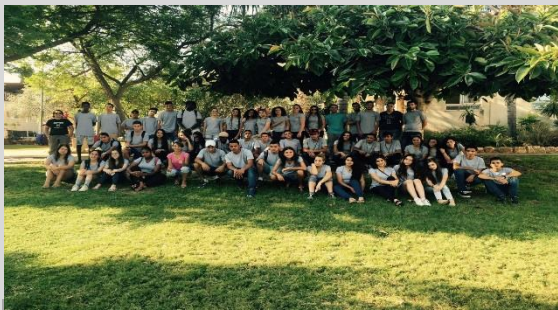
תמונה קבוצתית לסיום